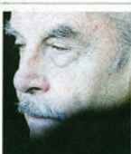
Josef Fritzl, l'orco austriaco

LUCIA ANNUNZIATA FRITZL VICINO DI CASA Italiando il better, dice un'ambigua battuta autorizzatoria con cui gli italiani amano spesso presentarsi nel mondo. Sappiamo fare quasi tutto meglio degli altri, incluso, pare, lo stupro. A Torino non uno ma ben due stupratori hanno abusato per 25 anni