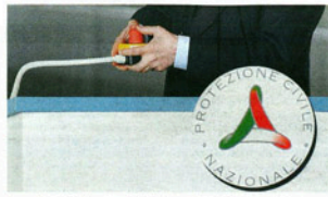
Il premier attiva il comando dell'inceneritore di Acerra ALLE PAG. 21

RETROSCENA «Io e Obama diciamo le stesse cose»